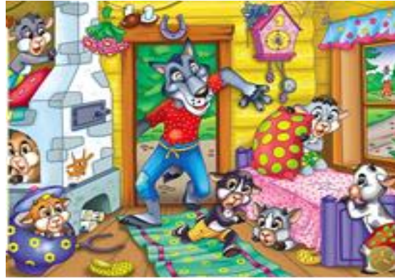
«Волк и семеро козлят»

Творческий процесс может сопровождать музыка: