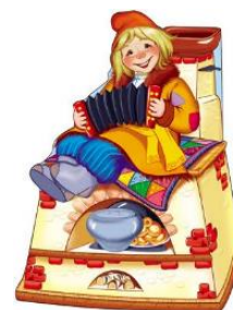
«По щучьему велению»