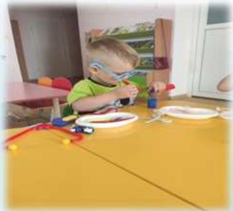
Сюжетно-ролевая игра «Игрушки у врача»