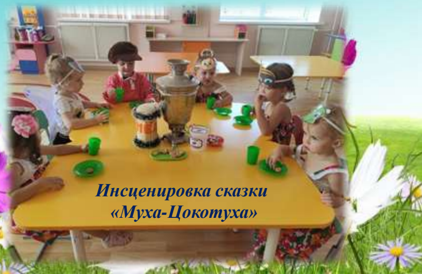
Инсценировка сказки «Муха-Цокотуха»