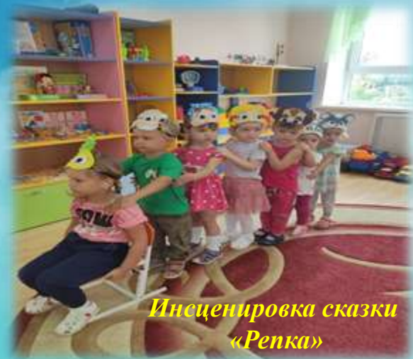
Инсценировка сказки «Репка»