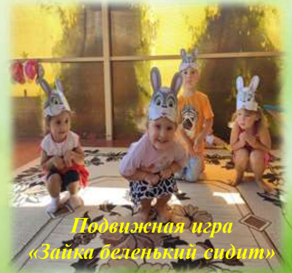
Подвижная игра «Зайка беленький сидит»