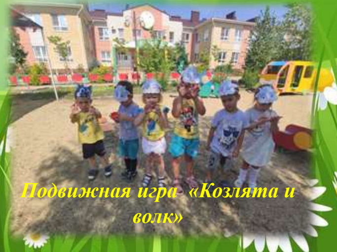
Подвижная игра «Козлята и волк»