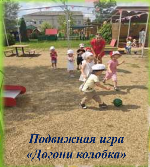
Подвижная игра «Догони колобка»