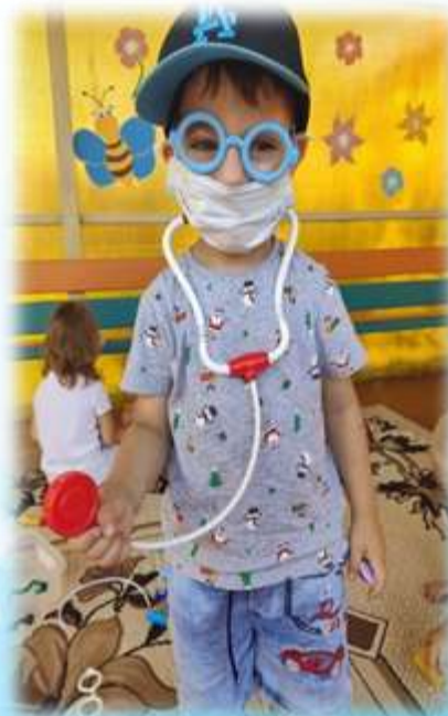
Сюжетно-ролевая игра «Доктор»