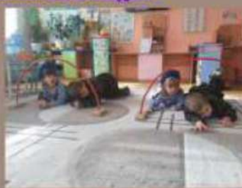
Упражнение «каким должен быть солдат»